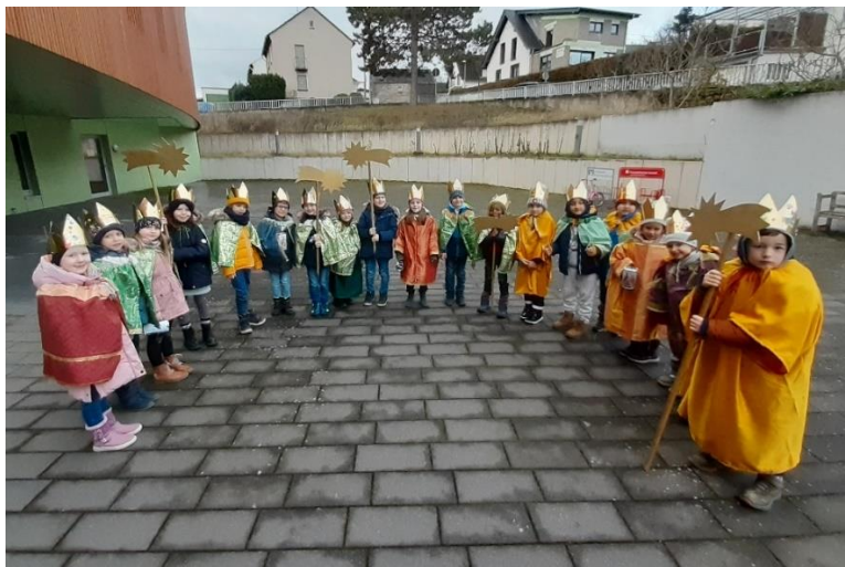
Die Sternsinger (Maxikinder) der KiTa St. Nikolaus, Niedermendig