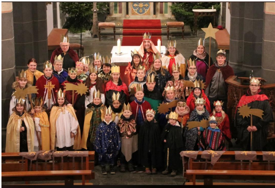
Die Sternsinger der Pfarrgemeinden St. Cyriakus und St. Genovefa Mendig

Für alle Bewohner, an deren Haustüre keine Sternsinger sein konnten, liegen die Segensaufkleber mit einem Überweisungsbeleg in der Pfarrkirche St. Genovefa, in der Pfarrkirche St. Cyriakus, in der Evangelischen Kirche und im Rathaus der Verbandsgemeinde in Mendig, aus.