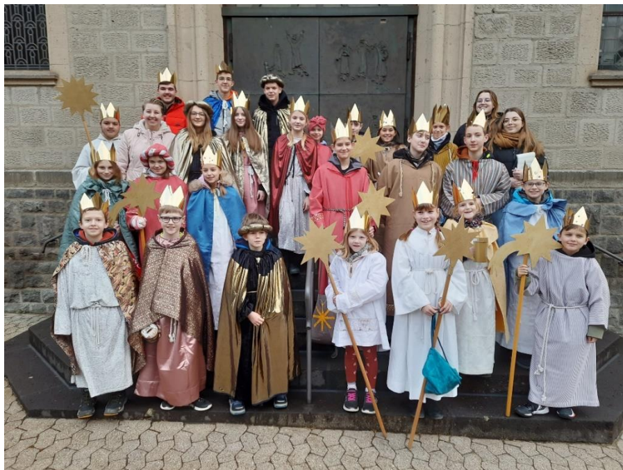
Sternsinger von Rieden/Volkesfeld